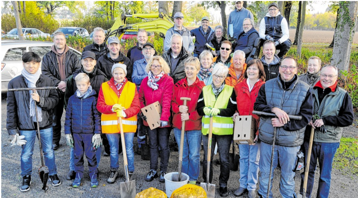
Aktive aus Damm und Bricht griffen am Samstag zum Spaten.

Die erste Pflanzaktion der Gemeinde wurde im Jahr 2015 häufig belächelt. Als die ersten Blumen dann zur Verschönerung einiger Straßen beitragen, nahm die Freude an dem schönen Anblick bei den Gemeindemitgliedern Ober-